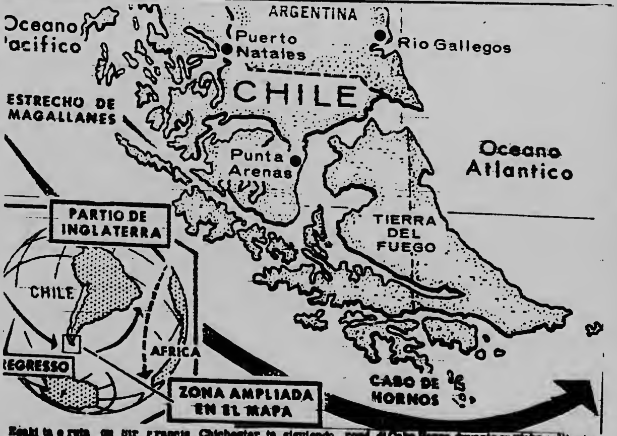
Esaki ta e ruta qu sir Francis Chichester ta siguiendo rond di Cabo Horno durante su viaje solitario di Australia pa Inglaterra.

CAIRO--UPI--E tormenta mas fuerte di stof y terra hamas conoci a azota ayera e ciudad